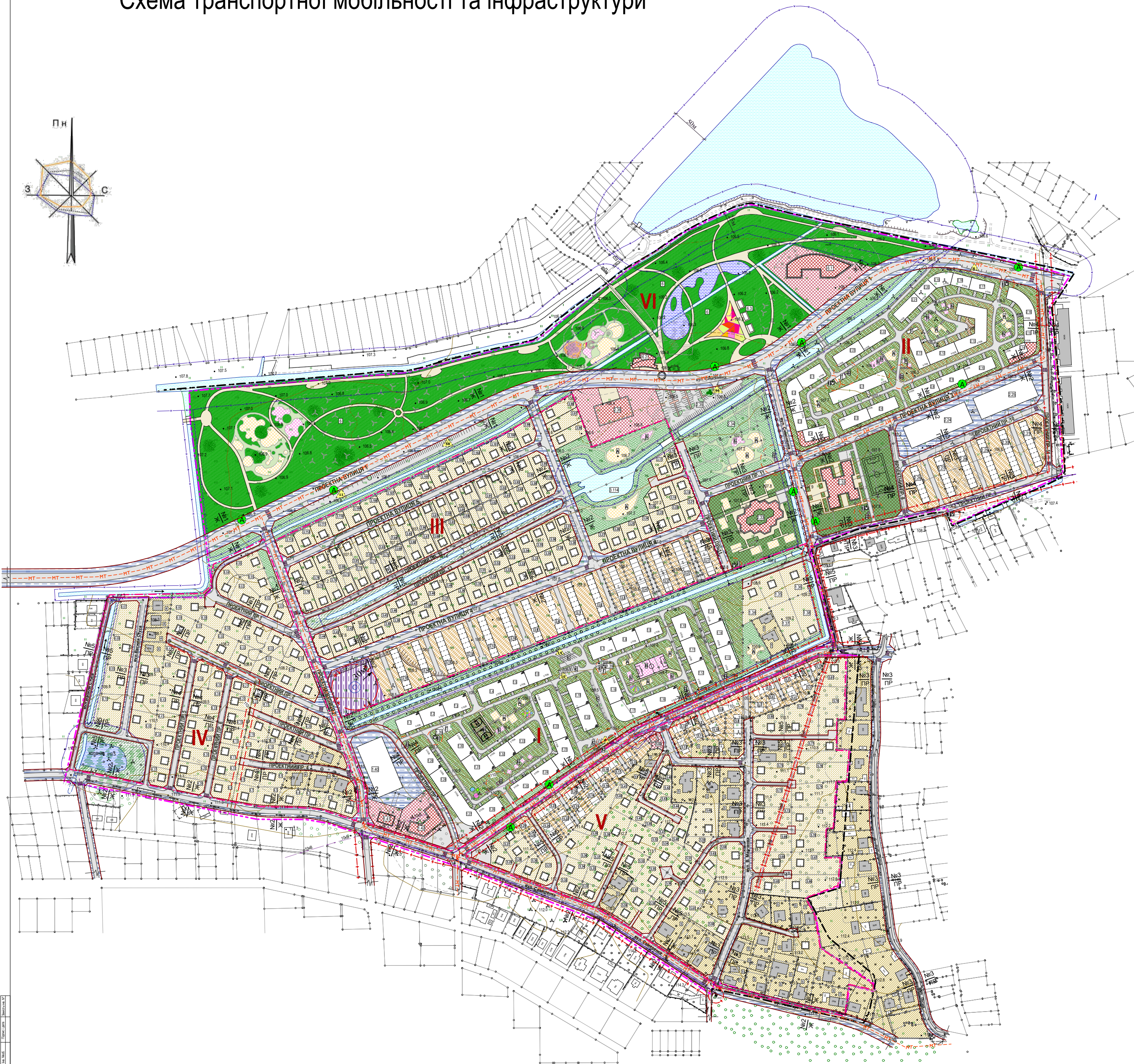
Схема транспортної мобільності та інфраструктури